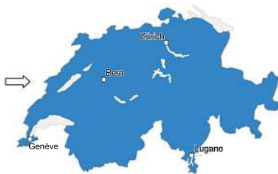
Abb.: SPR+ MobNat neu SPR+ MobNat spiegelt die gesamte Plakatleistung in der ganzen Schweiz wieder